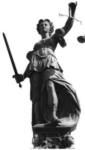
Justitia warnt: Vorsicht bei Regelungen zur Fälligkeit des Honorars

Anlass war eine Streitigkeit über die Fälligkeit der Vergütung aus der Planung der technischen Ausstattung eines Flughafens, deren anrechenbare Kosten unstreitig die höchsten Tafelwerte des Leistungsbildes nach § 74 HOAI 1996 überschritten hatten. Der Generalplaner für den Flughafen hatte mit dem Subplaner für die Technik mündlich vereinbart, dass dessen Honorar erst dann fällig werden sollte, wenn die entsprechende Forderung