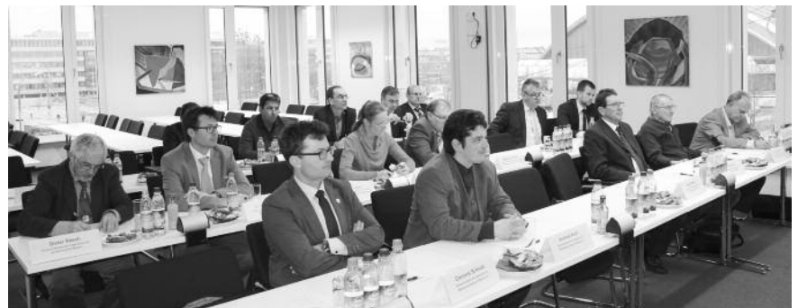
Gute Zusammenarbeit zwischen Kammer und Verbänden.