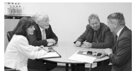
Enge Zusammenarbeit vereinbart.

Der Bund erhöht seine Investitionen in den Verkehrswegebau. Dadurch steigen die Planungsaufgaben in der Zukunft weiter an. Dr. Schroeter versicherte, die bayerischen Planungsbüros