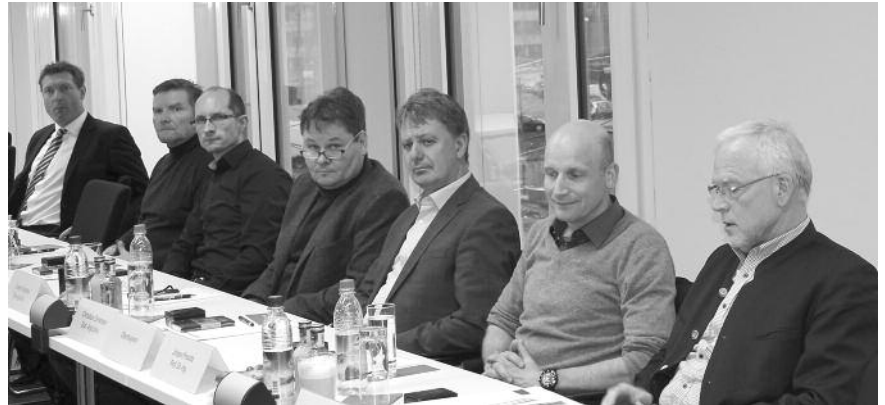
Die Vertreter aus Oberbayern und Mittelfranken.

Ein weiterer inhaltlicher Schwerpunkt lag auf den 2015 erfolgreich eingeführ-