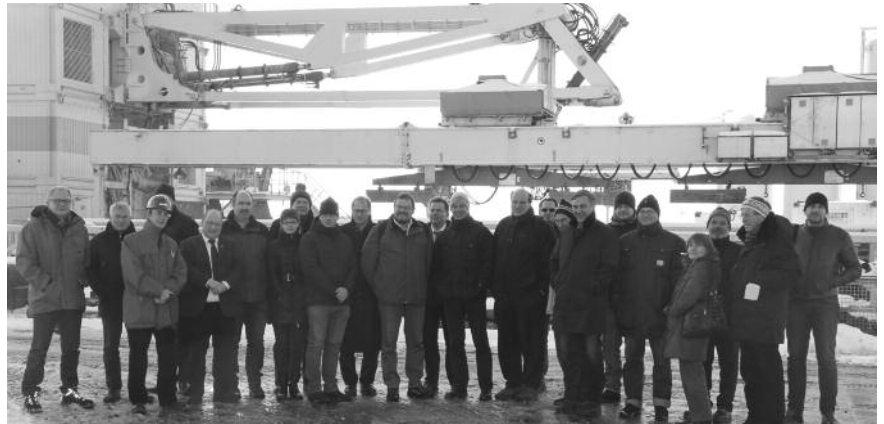
Die Exkursion zur Geothermie-Bohrung war nach wenigen Stunden ausgebucht.

Anschließend fuhr die Gruppe weiter zu dem Gelände in München-Freiham, auf dem die Bohrungen stattfinden. Die Vertreter der Stadtwerke informier-