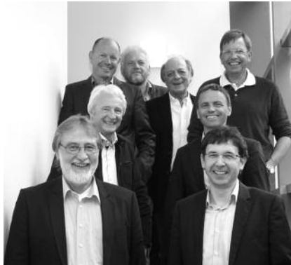
Ausschuss bringt Ingenieurleistungen in die Öffentlichkeit.

Da die Kammer sich in der Vergangenheit bereits als kompetenter und verlässlicher Partner für die Medien etabliert hat, erreichen das Pressereferat inzwischen auch regelmäßig Anfragen von Journalisten. Wie kann es gelin-