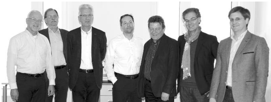
Der Arbeitskreis Netzwerk Kooperation.