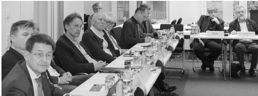
Niederbayern, die Oberpfalz, Schwaben und Oberfranken.

für die Foren und betonte auch das hohe Interesse der Mitglieder an den vielen angebotenen Baustellenbesichtigungen.