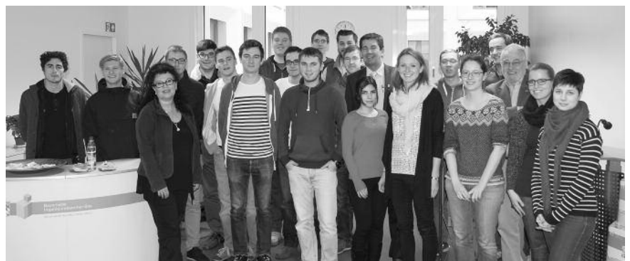
Angehende Geodäten informierten sich über die Kammer.

informierte darüber, dass der Eintrag in die Interessentenliste der Kammer seit Jahresbeginn kostenfrei möglich ist. Auch die neue „Studi-Seite“ der Kammer in der Bayerischen Staatszeitung war Gesprächsthema. amt