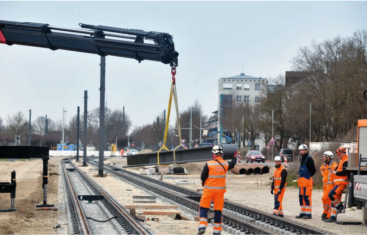
Verlängerung der Straßenbahnlinie 3 (Gleiskörper) in Augsburg