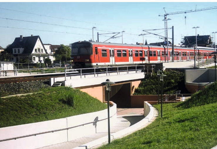
S-Bahn-Querung Schloßallee, Heusenstamm