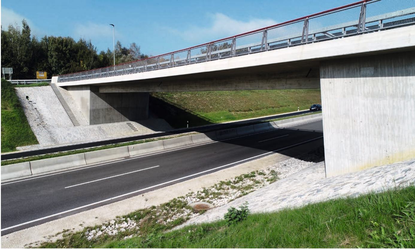
Ausbau B300 bei Aichach