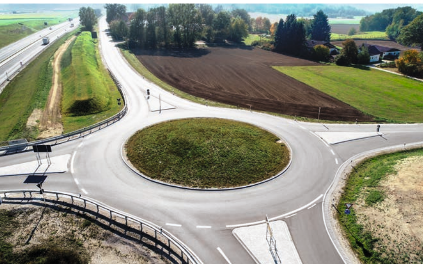
Ausbau B300 bei Aichach