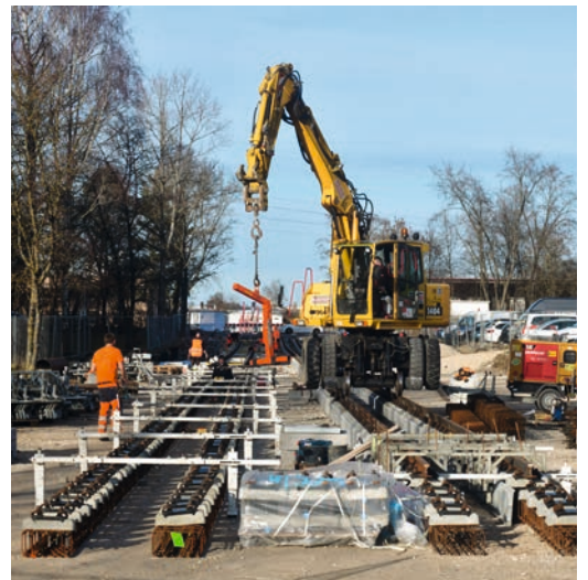
Verlängerung der Straßenbahnlinie 3 in Augsburg