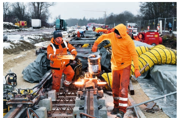
Verlängerung der Straßenbahnlinie 3 (Schienenschweißen) in Augsburg