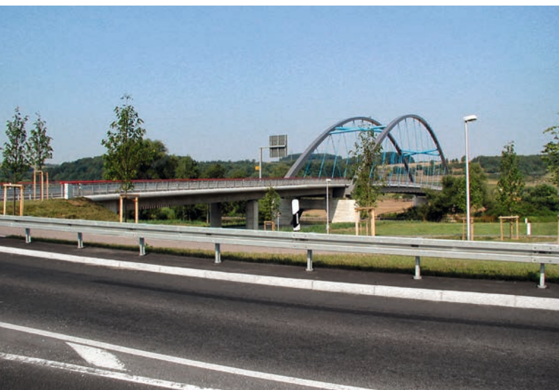
Mainbrücke Marktheidenfeld, StBA Aschaffenburg