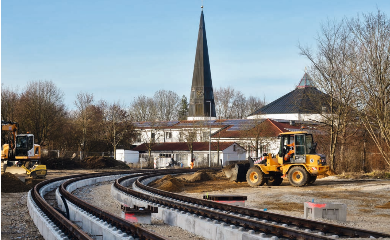
Verlängerung der Straßenbahnlinie 3 in Augsburg