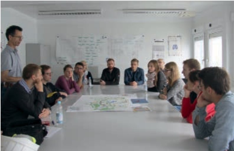
Ein wenig Berufserfahrung sollte bereits mitgebracht werden. Dann lässt sich leichter ein Bezug zu eigenen, konkreten Projekten herstellen und gezielt nachfragen.