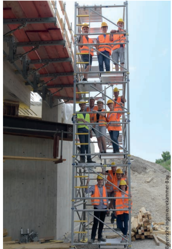
Die neun gemeinsamen Monate schaffen wertvolle Verbindungen.

Maier: Am Traineeprogramm teilnehmen zu dürfen, das motiviert ungemein. Ich verstehe das als ganz klares Signal, dass man weiterentwickelt werden soll, dass man jemand ist,