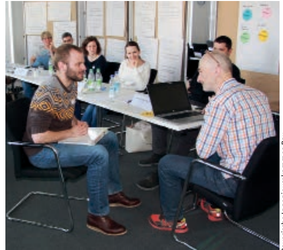
Positiv bewertet wird, dass das Traineeprogramm auch Soft Skills vermittelt.

4 junge Ingenieure der Bayerischen Ingenieurekammer-Bau.