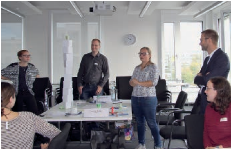
Eine besondere Herausforderung: Das Kommunikationstraining, bei dem am Anfang alle etwas skeptisch waren.